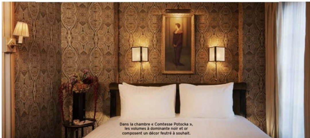
Dans la chambre « Comtesse Potocka », les volumes à dominante noir et or composent un décor feutré à souhait.